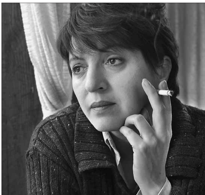
Mirjana Karanovićová vo filme Grbavica.