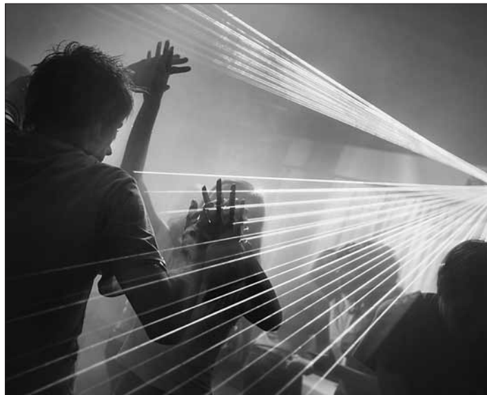
Hudbou a tancom oživa večer trenčiansky Artfilm STEPS Club.