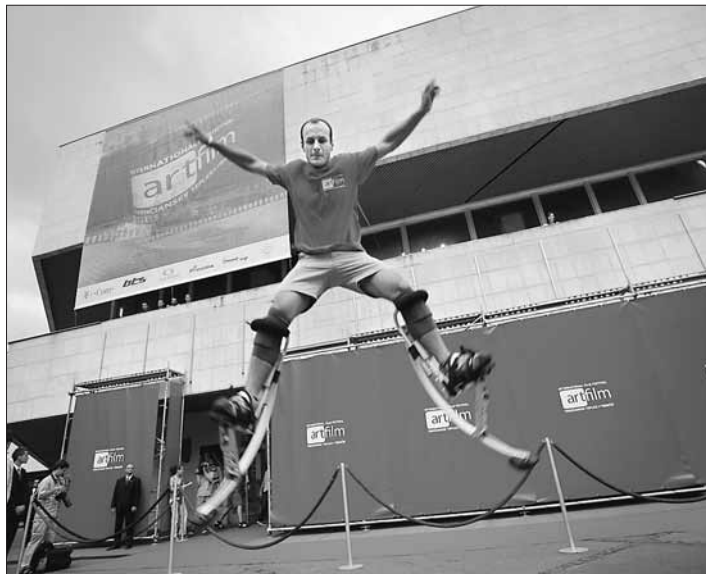
Centrum Trenčína vyplnil Artfilm.