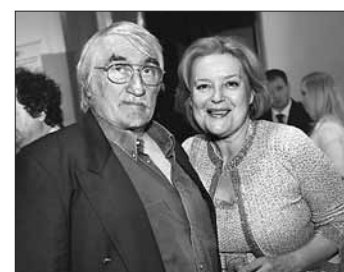
Pavel Landovský a Magda Vášáryová na tohtoročnom Artfilme.